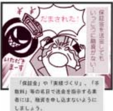
漫画 / やまでら 2009年