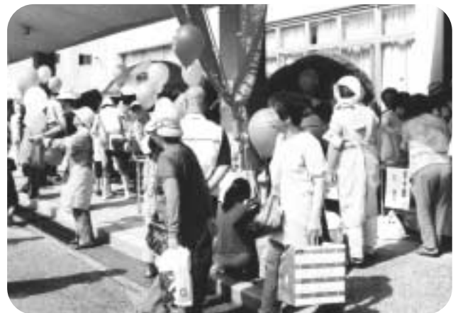
賑わう屋台コーナー