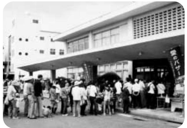
開店を待つ長蛇の列