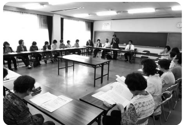
末武地区福祉員研修会

おおむね自治会単位に設置されており、市内では約270名の福祉員が活動しています。