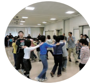
第1回スマイルクラブ