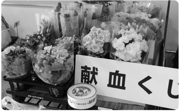
※当日献血された方にフラワーポットをプレゼントします。