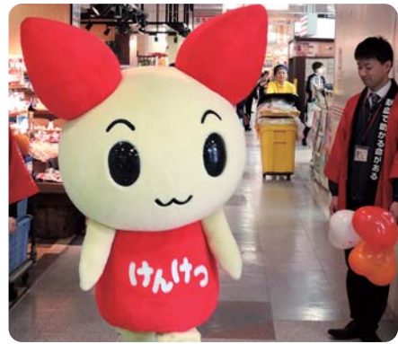
献血キャラクター けんけんちゃん