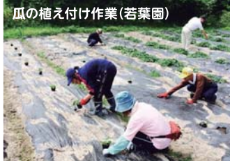
瓜の植え付け作業(若葉園)

獺祭の酒粕を使用した「大吟醸の奈良漬」「きゅうりの粕漬け」を1パック販売につき10円を寄付。 有限会社みかわ(岩国市)